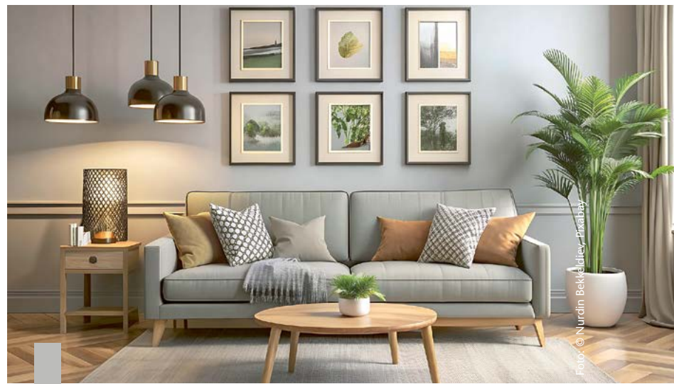
Die Wohnungssuche von Paaren konzentriert sich vor allem auf Eigentumswohnungen im Umland der Großstädte und erst an zweiter Stelle auf die Innenstadt.

Der Wunsch nach Wohneigentum ist in Deutschland weit verbreitet. Das liegt auch daran, dass die Wohneigentumsquote in Deutschland im europäischen Vergleich vor der Schweiz an vorletzter Stelle liegt. Laut einer Umfrage von ImmoScout24 sind 85 Prozent der jungen Erwachsenen zwischen 18 und 29 Jahren am Kauf einer Immobilie interessiert. Bei den Befragten unter 50 Jahren sind es 65 Prozent. Die Gründe für den Erwerb von Wohneigentum sind vielfältig: Sicherheit und Unabhängigkeit, Altersvorsorge und die Verbesserung der Wohnqualität sind die überzeugendsten Argumente. Die Altersvorsorge ist für die 40- bis 49-Jährigen am wichtigsten, die Verbesserung der Wohnqualität für die 60- bis 69-Jährigen. Die Hauptgründe gegen den Erwerb von Wohneigentum sind zu wenig Eigenkapital und zu hohe Preise.