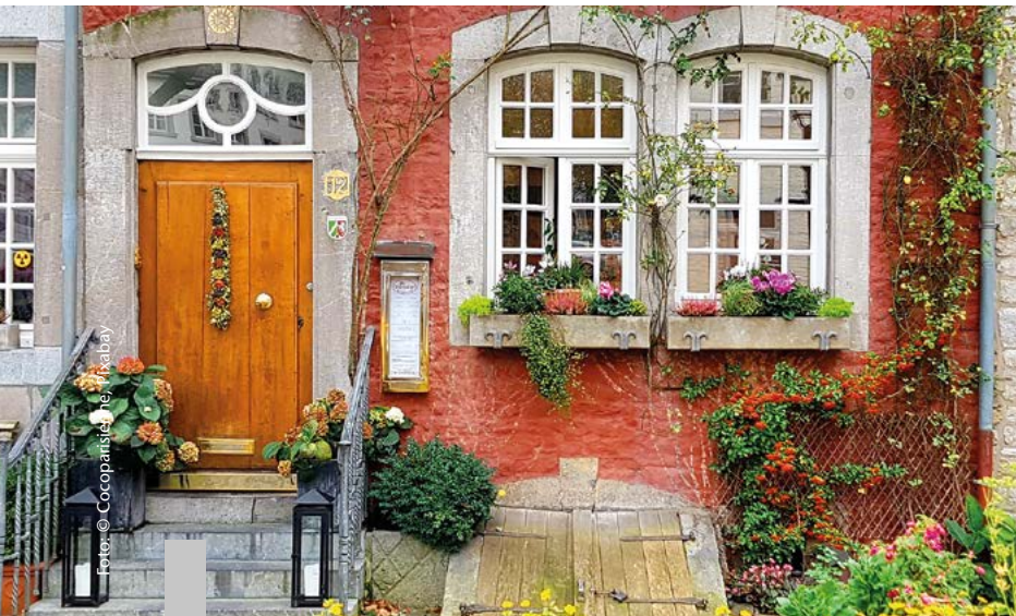
Die meisten Deutschen wünschen sich eine eigene Immobilie.

68 Prozent der Befragten einer Studie gaben an, in den eigenen vier Wänden leben zu wollen. Das freistehende Einfamilienhaus steht dabei mit 64 Prozent an erster Stelle der beliebtesten Wohnformen. Nach Ansicht der Befragten bietet das Einfamilienhaus die größte Freiheit, die eigenen Wohnräume zu verwirklichen. Gleichzeitig sei das Einfamilienhaus ein wichtiger Rückzugsort für Familien und Paare. Die Wirklichkeit sieht anders aus. Laut der Allensbacher Markt- und Werbeträgeranalyse 2023 leben nur 29 Millionen Menschen in den eigenen vier Wänden, 37 Millionen dagegen zur Miete.