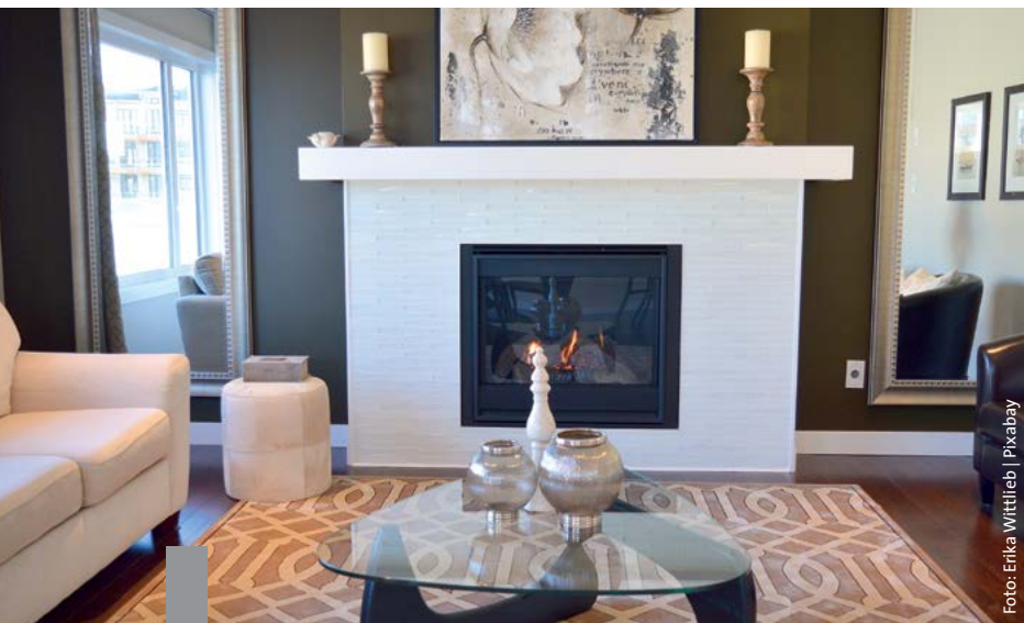
Ein warmer Sommer garantiert keine niedrigen Heizkosten im Winter.

Der Wärmemonitor 2018 des Deutschen Instituts für Wirtschaftsforschung zeigt: Die deutschen Privathaushalte haben 2018 im Durchschnitt zwei Prozent mehr Heizenergie verbraucht. Seit 2015 ist der Heizenergiebedarf um sechs Prozent pro Quadratmeter gestiegen. Teuer wurde dies für Häuser mit Ölheizung: 2018 stieg der Heizölpreis um neun Prozent, während der Gaspreis im Schnitt um vier Prozent sank. Rund die Hälfte der Mehrfamilienhäuser wird mit Gas beheizt, ein Viertel mit Öl. Der Wärmemonitor zeigt auch die Sanierungsquote: Zwischen 1992 und 2000 schwankte der Anteil der pro Jahr neu gedämmten Häuser im Osten Deutschlands zwischen ein und vier Prozent. Im Westen stieg er seit 1992 von 0,3 Prozent auf knapp ein Prozent; seit 2016 fällt er wieder. Energetische Sanierungen senken den Wärmebedarf.