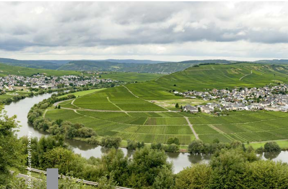
Deutschland ist von einem zusammenhängenden und dichten Netz aus Gebäuden bedeckt. Wenn es um nachhaltige Entwicklung und Klimaschutz geht, ist das Thema Flächennutzung von zentraler Bedeutung.

Wer in Deutschland im Wald steht, der hält sich nur vermeintlich in abgelegener Natur auf. Egal an welchem Ort man sich befindet, das nächstgelegene Haus ist nicht weiter als 6,3 Kilometer entfernt. Für 99 Prozent des Gebäudebestandes gilt sogar: Das nächste Haus befindet sich in maximal 1,5 Kilometer Abstand. Dieses Ergebnis hat die Wissenschaftler des Leibniz-Instituts für ökologische Raumentwicklung (IÖR) überrascht. Sie wollten untersuchen, bis zu welchem Grad Deutschland überbaut ist und ob es hierzulande überhaupt noch gebäudefreie Zonen gibt. Ob Wohnhäuser, Fabrikgebäude oder Garagenhof – alle Gebäude in Deutschland mit einer Grundfläche über zehn Quadratmeter wurden bei den Berechnungen berücksichtigt. Das größte gebäudefreie Gebiet misst gerade einmal 12,6 Kilometer im Durchmesser.